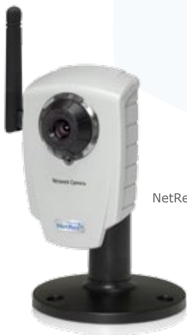
NetRex AXIS 207W

Cena platí při úhradě služeb na 12 měsíců dopředu. Při měsíčních platbách služby stojí 299,- Kč bez DPH.